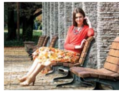
Zoom óptico 10x