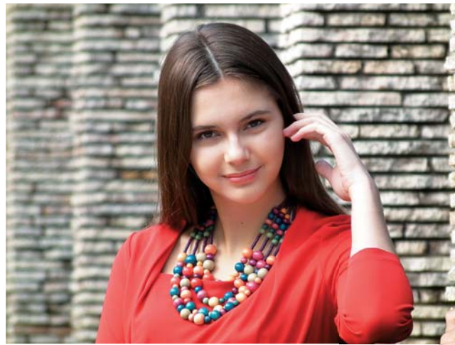
Zoom óptico 30x