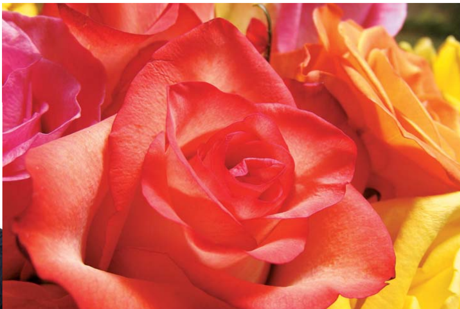
Macro El enfoque macro de hasta 2cm permite llenar el fotograma con imágenes de asombroso detalle.