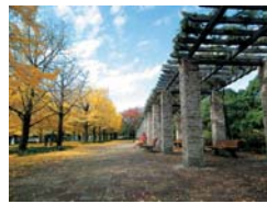
Gran angular 24mm

Equipada con un objetivo zoom súper largo Fujinon 30x, la FinePix S4000 ofrece un rendimiento extraordinariamente versátil. El fluido control del zoom en 45 pasos, desde gran angular de 24mm hasta una impresionante posición teleobjetivo 30x, permite encuadrar cada imagen con gran precisión.