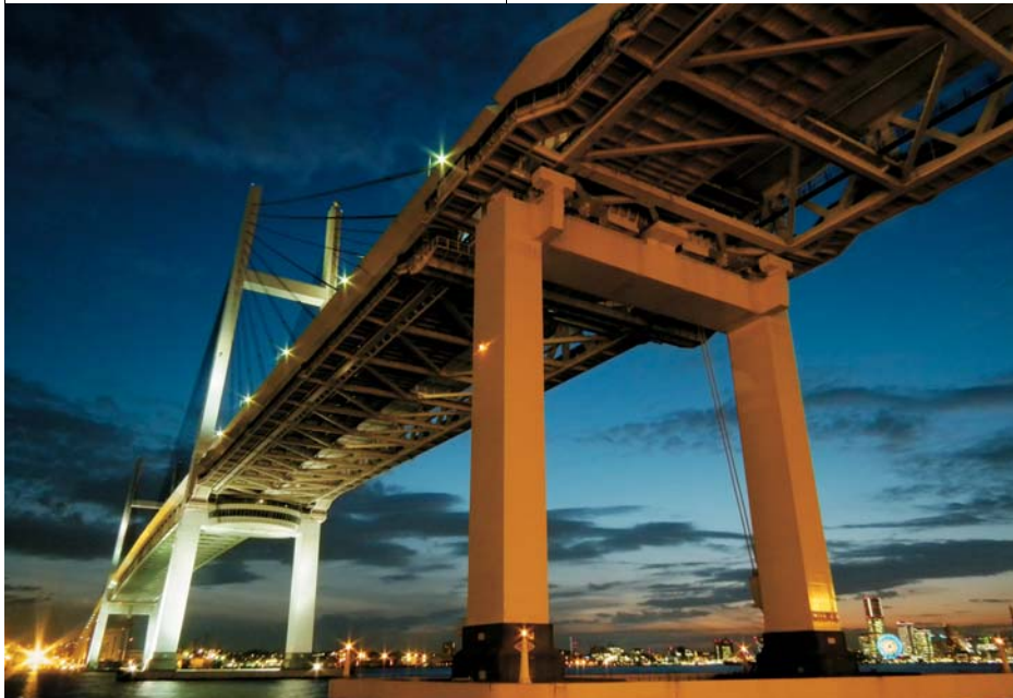
24mm La ventaja de un objetivo gran angular de 24mm permite captar paisajes dinámicos y vistas de gran amplitud.