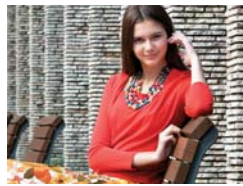
Zoom óptico 20x