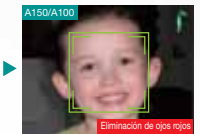
Eliminación de ojos rojos

◆ Alta sensibilidad ISO 1600 Imágenes nítidas incluso con poca luz