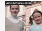
Oportunidad fotográfica perdida