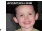
Oportunidad fotográfica perdida