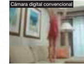
Cámara digital convencional

Elimina el desenfoque de los sujetos en movimiento