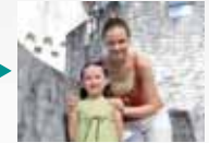
Zoom óptico 3x

◆ Detección de Rostros con eliminación automática de ojos rojos