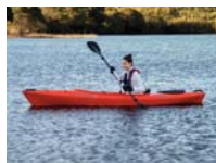
Zoom óptico 5x