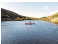
Gran angular 28mm

El versátil objetivo zoom 18x cubre cualquier situación fotográfica para que nunca se le escape la oportunidad de disparar.