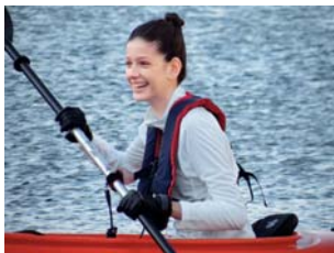
Zoom óptico 18x