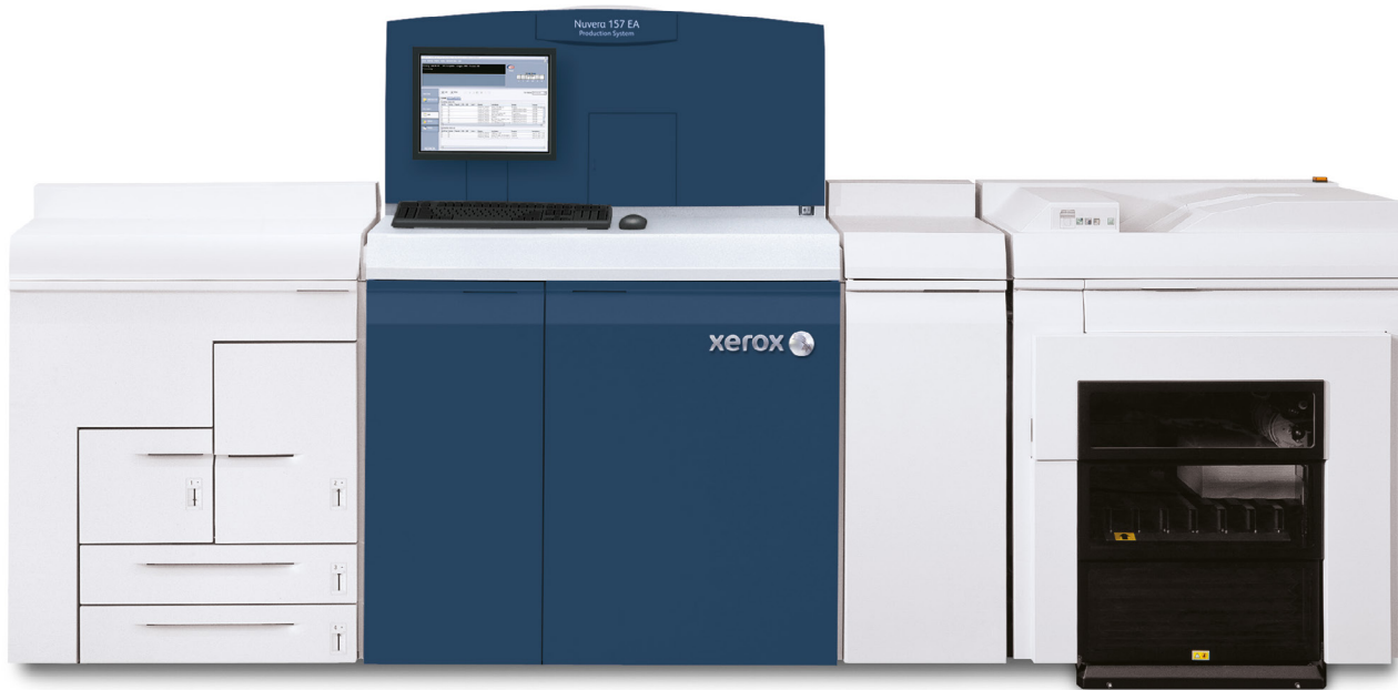
Sistema de producción Xerox Nuvera® 157 EA con apilador de producción Xerox®