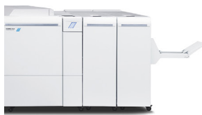
Realizador de folletos Plockmatic Pro 50/35 (Disponible sólo para 120/144/157)