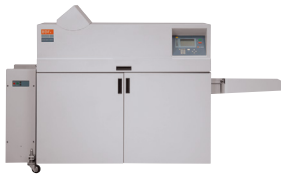
Realizador de folletos C.P. Bourg BDFNx