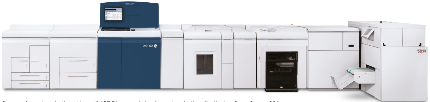
Sistema de producción Xerox Nuvera® 157 EA con apilador de producción Xerox® y Watkiss PowerSquare 224