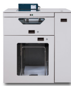
Alimentador de hojas de modo dual C.P. Bourg BSFx