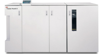
GBC® FusionPunch® II con Apilador por desplazamiento