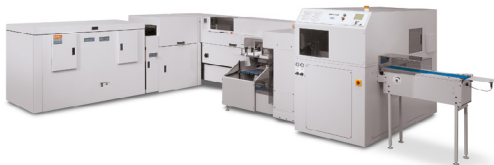
Xerox® Book Factory