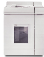
Módulo de acabadora básica