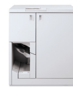
Xerox® Tape Binder